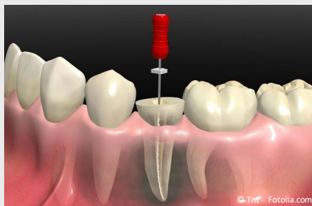
Wurzelbehandlung eines zerstörten Zahnes

Wurzelbehandlungen werden generell mit Betäubung durchgeführt. Deshalb sind sie in aller Regel nicht schmerzhaft . In seltenen Fällen (wenn ein Zahnerv sehr stark entzündet ist), können trotz Betäubung während der