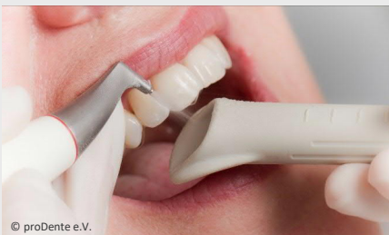
Zahnreinigung mit Pulverstrahlgerät

Auch wer seine Zähne regelmäßig und sorgfältig putzt, erreicht nicht alle Zahnoberflächen. Das sind vor allem die Stellen unter dem Zahnfleisch, in manchen Zahnzwischenräumen und die sehr feinen Grübchen auf den Kauflächen.