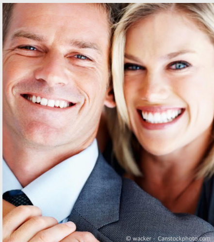
Selbstsicher mit gepflegten Zähnen

Dann werden Mund, Zähne und Zahnfleisch untersucht. Die Zahnbeläge werden angefärbt, um sie besser sichtbar zu machen und es wird die Tiefe der Zahnfleischtaschen gemessen.